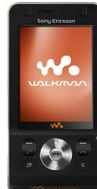
Sony Ericsson W910i Walkman

www.truephonemadness.com Descargas de juegos GRATIS